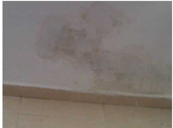
Visible Light Image